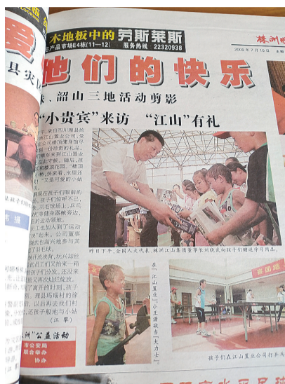
▲2009年6月,理县孩子来株,本报报道的版面截图

“那是袁伯伯第一次骂我,但从他的责骂中,我看到了父亲的影子,我那晚哭了一晚,是因为感动。”徐永芝说。