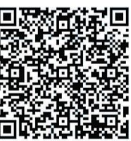
晚报乐活周刊微信群