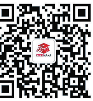
株洲晚报老年大学 微信公众号