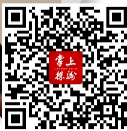
了解政策详细内容,请扫二维码。