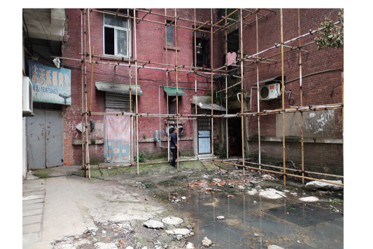
▲洗煤小区28栋楼前污水横流,居民只能绕行回家

肖旭表示,28栋居民投诉的污水问题,他们会尽快想办法解决。他承诺,近几天社区会调来吸粪车处理污泥,将楼栋门前的污水排干净。