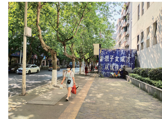
▲建有商铺的人行道很狭窄