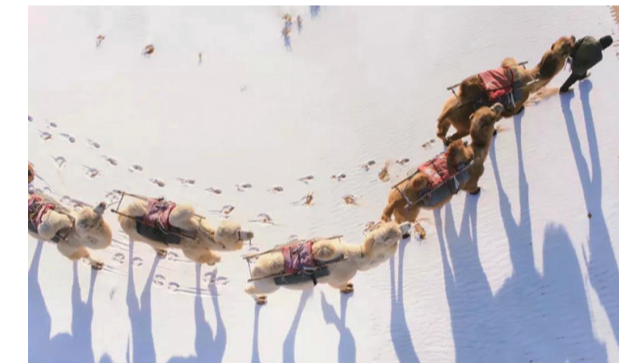
▲宁夏,腾格里沙漠的雪景