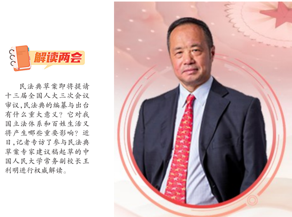
▲中国人民大学常务副校长王利明(资料图)