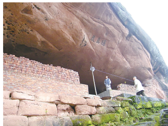
嵌入峭壁半腰间的隐真岩