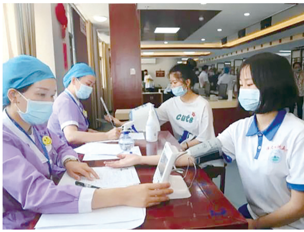
5月13日,醴陵市5282名考生陆续接受高考体检,当日第一批参加体检的是五雅中学的高考考生,共有140人。图为考生接受血压测量。为确保高考体检结果客观公正、准确无误,该市纪委派驻教育局纪检组人员对体检进行全程监督。

“考生体检后,签名确认,一定要通读一次体检表”。市教育考试院相关负责人表示,如出现与自己不符的体检结果,特别是不利结果时,考生一定要当场提出,积极沟通。拿到报告后,还要认真查看,对照《招生简章》和《普通高等学校招生体检工作指导意见》,看看哪些专业不能报,以免出现退档,导致错过理想的院校。