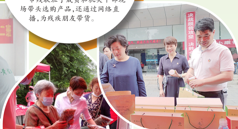
▲爱心人士采购残疾人生产的农副产品