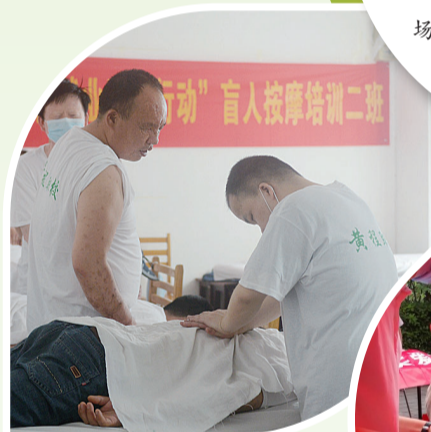
▲市残联通过助盲就业脱贫行动,让盲人免费学习技能