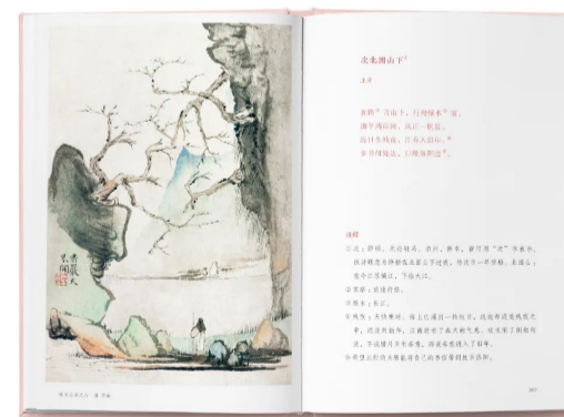
▲注释、注音、评析、小传一应俱全