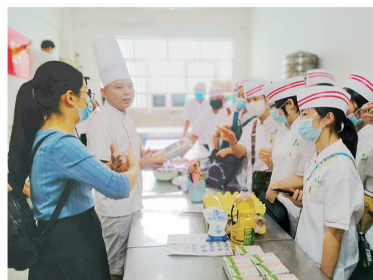
▲活动现场,培训老师耐心地讲解、演示

本报讯(记者 戴凛)今天是第30个全国助残日,昨日,株洲市聋协在黄程职业技术学校举行聋人糕点培训趣味活动,20余名聋人又免费学会了一门新技能。