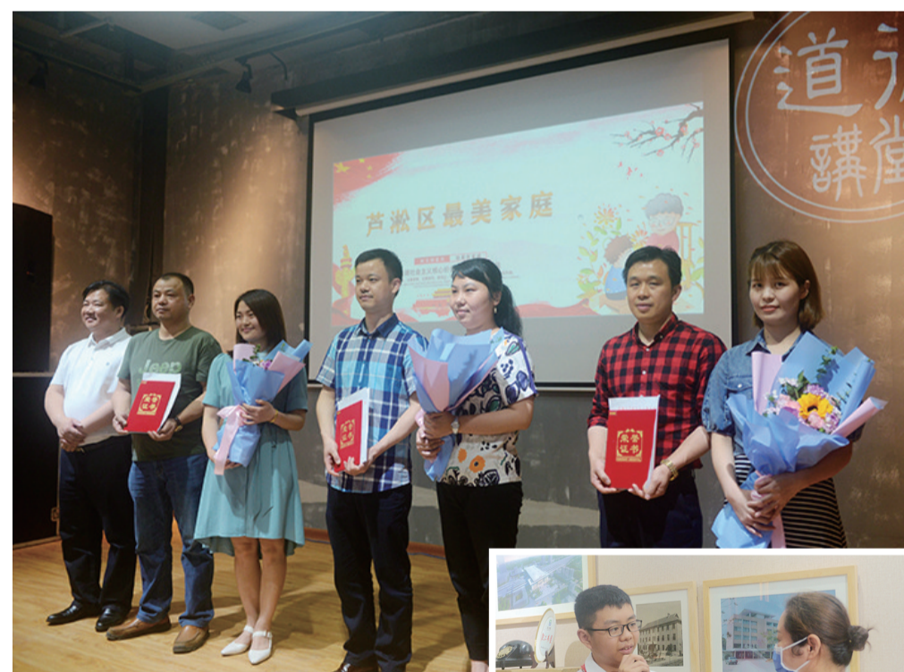
▲芦淞区最美家庭受到表彰