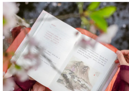
▲诗中有画,画中有诗

为了确保大家读到完整、准确的《唐诗三百首》,我们以清代陈婉俊补注《唐三百首》为底本,据光绪十一年(1885年)四藤吟社刊本断句排印,重新编排成全新《唐诗三百首》,并以原汁原味呈现给你。