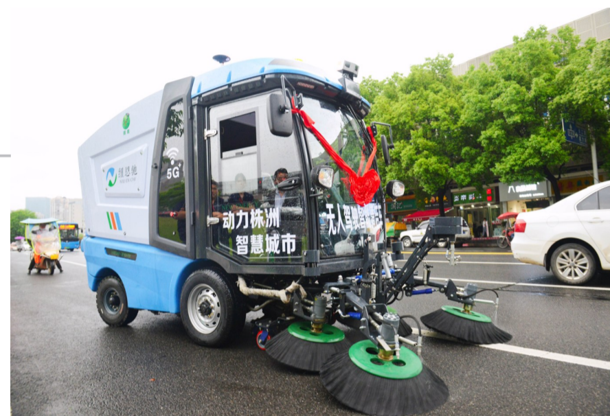
▲5月15日,神农城,新能源无人驾驶智能清洁车开始上路作业