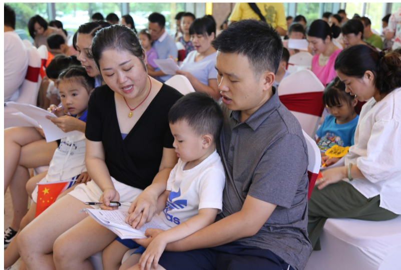
▲“稻花香”读书会开展亲子共读活动 通讯员供图