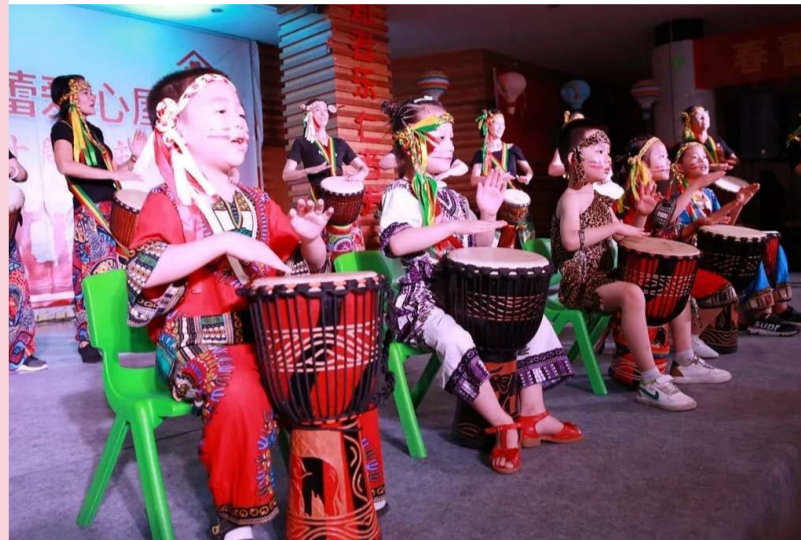
▲春蕾爱心屋项目中,孩子们在开展活动