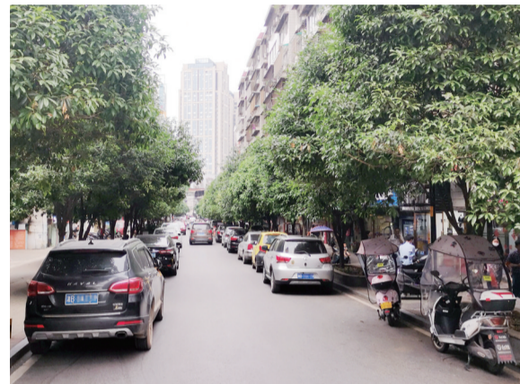
▲金铺路,两侧都是违停车辆,会车即堵车

此外,长江南路紫竹茗园、阳光小区路段,不少小区居民直接将小车横停在主干道上。下班时间后该现象更是突出,马路俨然成了一个停车场。