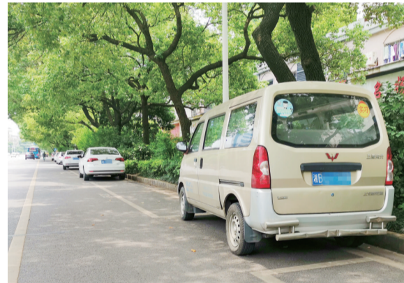
▲长江南路,沿线多台车辆均停在车位之间