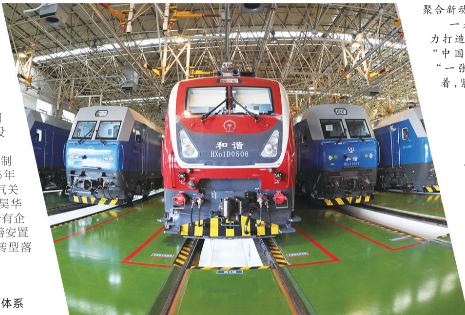
▲整装待发的株机牵引车

心:污染治理问题已成为高质量发展过不去的“拦路虎”,必须坚决全面关停搬迁!既要金山银山,更要绿水青山,从“根”上变换株洲发展底色。市委书记、市人大常委会主任毛腾飞掷地有声:“要彻底实现清水塘老工业区剩余企业的搬迁改造,还株洲人民一个真正的‘清水塘’。”市委副书记、市长阳卫国也表示,“推动关停搬迁、转型升级,建设一个新的清水塘。” 老工业区企业整体关停搬迁,也没有可复制的经验。株洲在探索中前行,在2013年至2016年关停94家污染企业的基础上,2017年一鼓作气关停企业147家,2018年又一举关停五矿株冶、昊华化工等一批大型企业,实现清水塘老工业区所有企业关停搬迁目标,实现老工业产能全面退出,妥善安置3万多名企业职工,服务引导61家企业异地转型落户,实现了“三年大见成效”的目标。