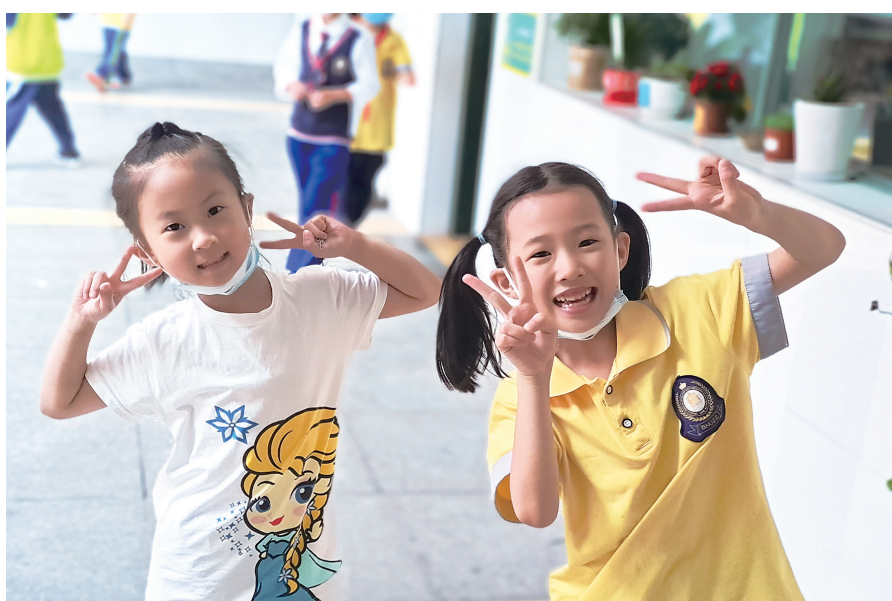
5月8日,国家卫健委、教育部发文规定,像株洲等低风险地区,学生在校内可不佩戴口罩。5月9日,北师株洲附属小学一年级学生,在校内摘下口罩,露出灿烂笑容。