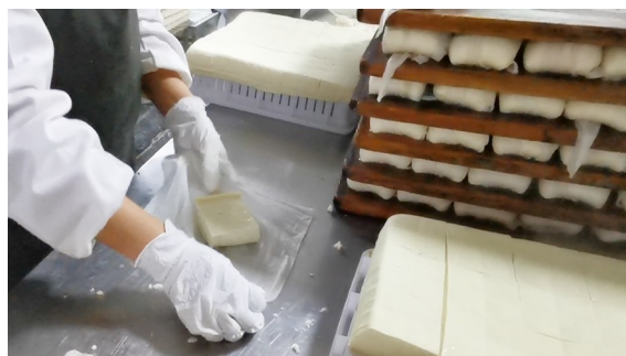
豆腐制作环节之手工包豆腐。

攸县豆腐远近闻名,并创造出了独特的“豆腐文化”,深受各地食客的高度好评。拍客向企业负责人详细了解了攸县香干的生产过程,从选料、浸泡、磨浆、挤浆、煮浆、点膏、压制等环节进行了拍摄。一起来学豆腐制作吧。