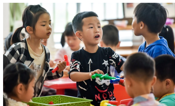
经过漫长的一个假期,孩子们又能和小伙伴一起开心玩耍了。

5月7日起,全市15万名幼儿陆续回归校园。早晨8点,在天元区新马中心幼儿园,孩子们牵着家长的手,前来报到到了。在入园前,孩子们先接受体温、鞋底细菌消杀,再进行身体健康检查,保健人员逐一查看孩子咽部、手心、手背等,方可入园。该园共有225名幼儿,当天大班第一批返校,75名幼儿有60名返园。