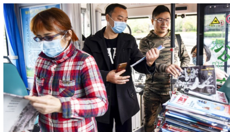
市民在阅读公交上阅读书籍。

4月23日是第25个世界读书日。当日,在神农大剧院前坪,4辆阅读公交车,正式发车。阅读公交包括T1路和T2路线的4辆公交车,公交车上印有“知识就是力量,读书改变人生”的标语。