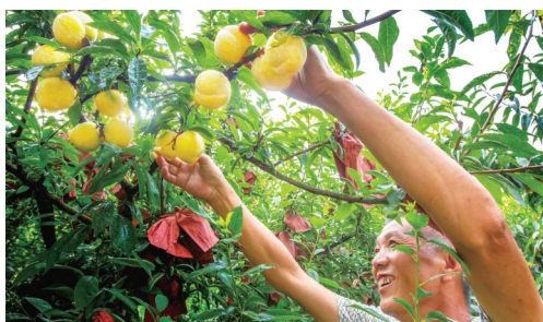
炎陵黄桃喜丰收(资料图)。

再过一个月,炎陵黄桃就要上市啦!近年来,炎陵黄桃声名鹊起,热销各地,成为炎陵县很多农民致富的“黄金果”。去年,中村瑶族乡黄桃小镇入选了湖南首批十个农业特色小镇。炎陵县中村瑶族乡位于罗霄山下湘赣交界处,海拔1000米的果园里,溪流淙淙,山清水秀,黄桃成熟时,满山黄桃果散发出清甜的香味。大山深处的瑶族乡与外界唯一的连接通道,是一条全长5.5公里、宽仅2.2米的崎岖山路,大货车无法进入,进出都靠摩托车、小三轮。