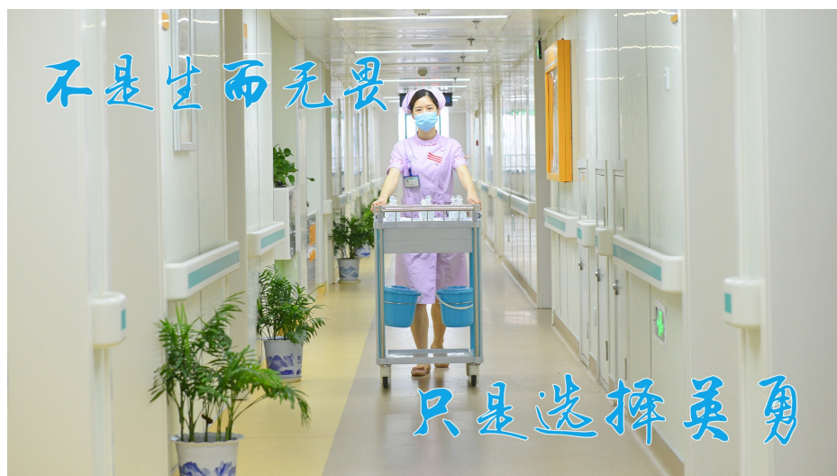
不是生而无畏,只是选择英勇。