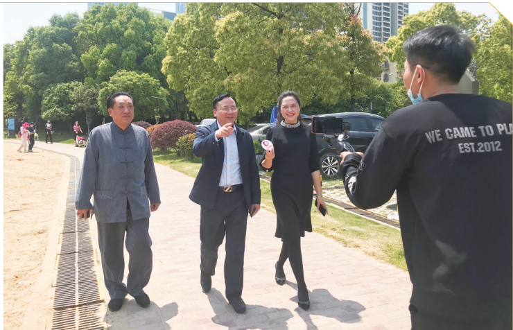
市商粮局长潘才良在火龙果视频直播间为消费代言。

抗疫情,促消费。全市商粮局长组团直播为消费代言活动圆满落幕,11场直播累计吸引700万人观看,带热了一波株洲消费。11场直播中,包括市商粮局长潘才良在内,各县市区的商粮局局长轮番上阵,为当地特色产品“代言”。潘才良作为首场直播嘉宾,走进株洲市新媒体中心火龙果视频直播间。