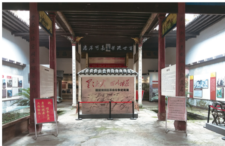
▲醴陵南四区苏维埃革命纪念馆内景