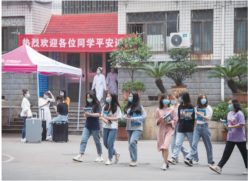
5月8日,湖南省部分高校开学复课。图为当日在湘潭医卫职业技术学院校园,学生们准备去上课。