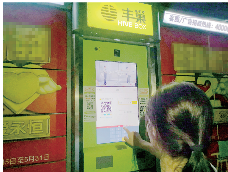
▲市民使用丰巢取件