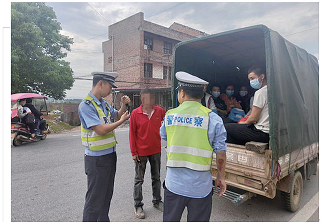
▲三轮车上坐满学生,交警在现场查处

7日上午10点,记者联系市政工程维护中心的工作人员,反映钟先生所说的问题。工作人员表示,他们会尽快派人去现场核实,如果主马路的下水井管道堵塞,他们会疏通管道,解决下水道堵塞的问题。