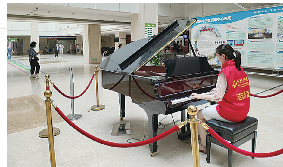
▲志愿者在演奏