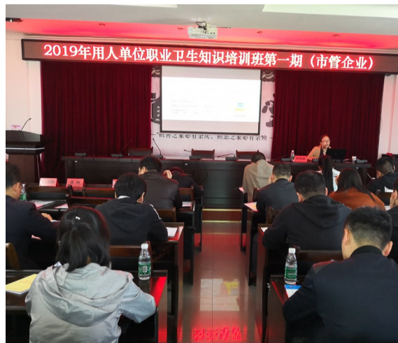
为用人单位培训职业卫生知识。