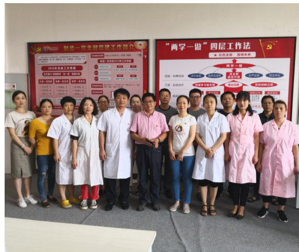
株洲职业病防治工作者。

4月的最后一周,是我国第18个职业病防治法宣传周,我市职业病防治中心组织开展了以“职业健康保护·我行动”为主题的相关宣传教育活动。按照新冠肺炎疫情防控要求,本次宣传周的活动以线上为主,线下为辅。期间,发放政策宣传单、设立职业病防治法律法规咨询台,为劳动者提供职业健康权益咨询服务,并同步开展《职业病防治法》知识问卷调查,进一步掌握企业员工职业病相关知识知晓率。本期健康周刊关注职业病防治宣传教育,并将今年职业病防治的有关重点,进行梳理和编辑,希望相关企业、个人能有所收获,有所了解,保护劳动者健康。