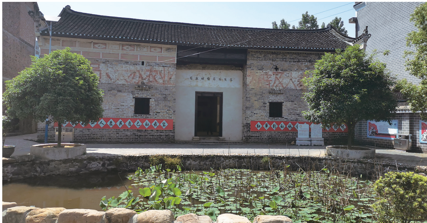
位于湾里村的茶陵县苏维埃政府旧址。