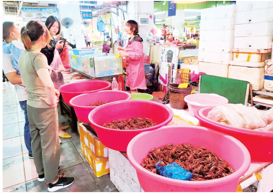
市民在农贸市场选购小龙虾。戴凛 摄

年批发价的一半。”一位经营者介绍,他的货源主要来自岳阳,今年小龙虾迎来丰收。由于小龙虾养殖简单,近年来,株洲很