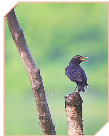
▲站在树干上吹吹风