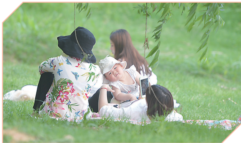
▲市民在绿地上享受清凉

今天立夏。 立夏,是“绿树阴浓夏日长”,也是“树阴照水爱晴柔”。 初夏,也因为这个节气而日渐充盈。 不知这个节气,是否是你最喜欢的时节,而关于它的记忆,是什么呢?是树荫下闲适的躺椅,是古巷里悠扬的歌声,奶奶手中的蒲扇?还是炎热的阳光,狂放的雷雨,浓浓的绿荫? 在大多数人的记忆匣子里,初夏的印象都和这座城市有关,或是石峰公园里蔷薇满园,一树一树的花开;或是芦淞区建设村那栋古旧房屋旁,白玉兰的幽香,它总会出现在初夏的雨后,而房屋那头远黛青山,被迷雾深藏。也是黄昏时分风光带旁,夜宵店早已人声鼎沸,而旁边石榴花清新的香气就这样吸引了穿着白纱裙的少女。 这样初夏的岁月,是诗情画意,也是烟火生活。 新的一季,准备和它说“你好吗”? (记者 王娜/文)