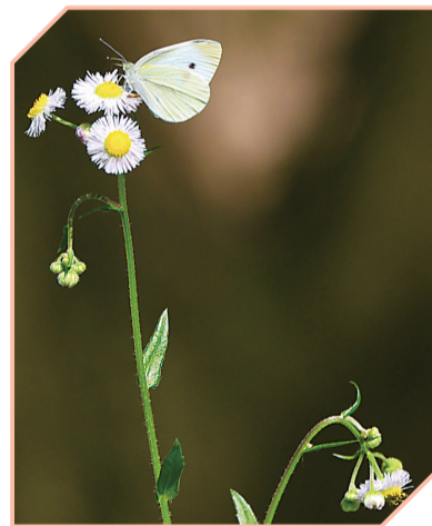
▲蝴蝶与花朵的私语