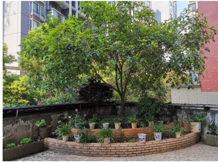
▲庐山恋14栋临街门面屋顶，住宅业主建设的一处花园

近日，天元区庐山恋小区14栋临街门面的业主拨打晚报新闻热线28829110反映：去年3月份，我们发现门面屋顶被14栋住宅楼2楼的4户业主建了花园，因泥土有上百吨，还种了大树，导致楼板超负荷承重，出现长达6米左右的直线裂缝，多处横梁严重弯曲变形，存在重大安全隐患。