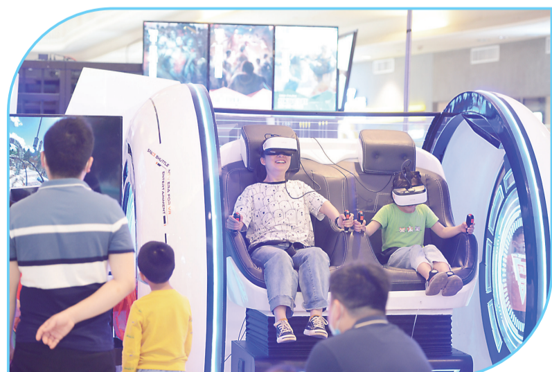
▲孩子们体验VR智能游戏