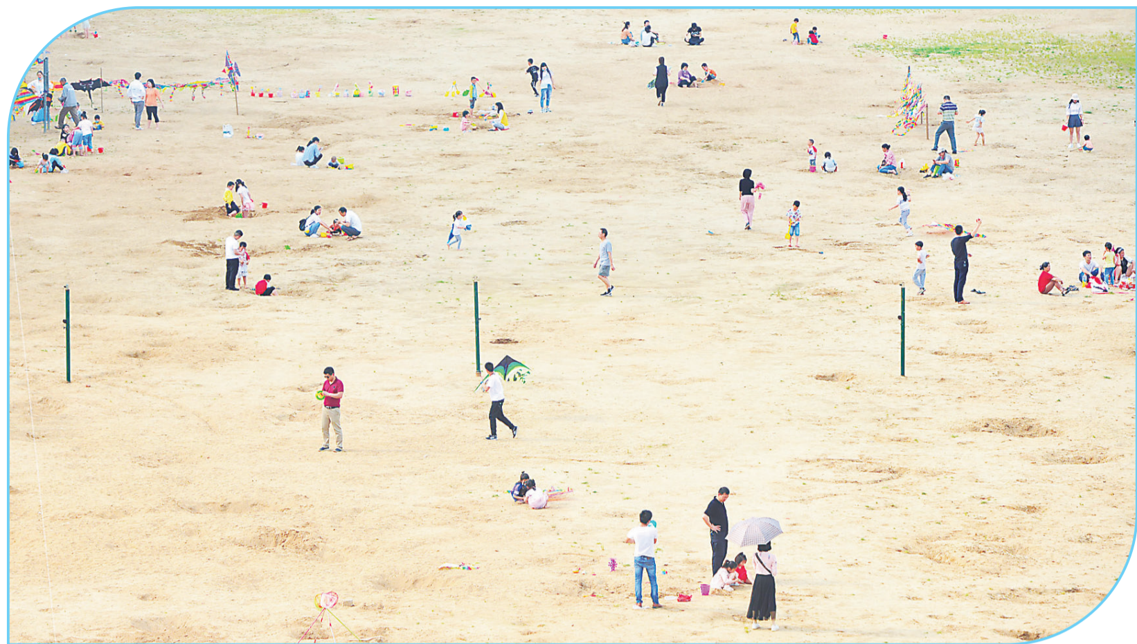
▲假日的沙滩成了亲子乐园