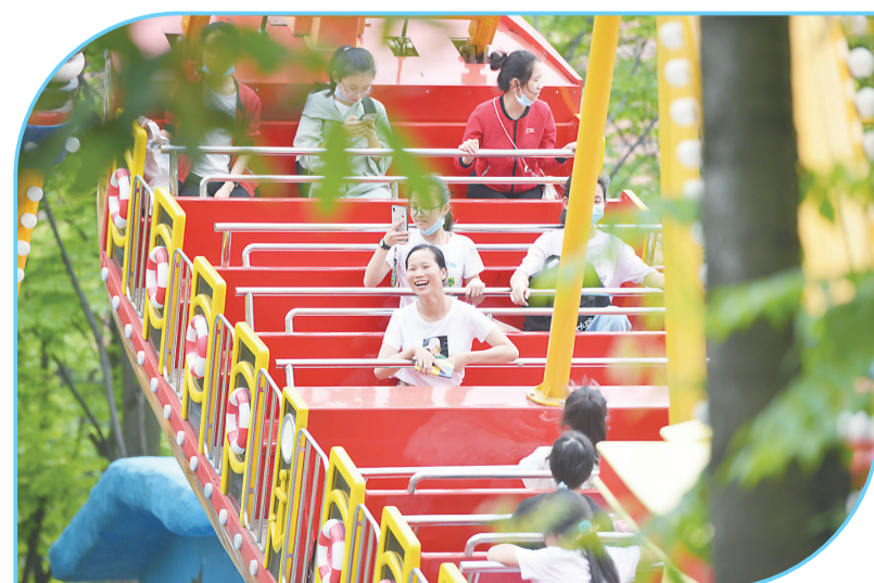
▲海盗船上欢呼声不断