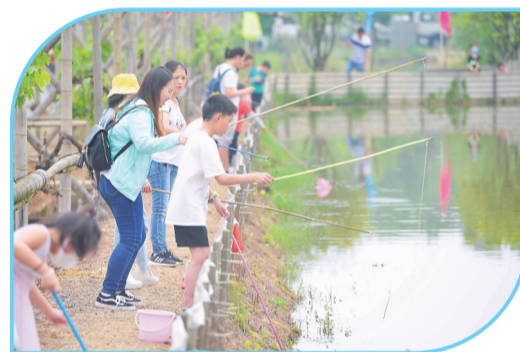
▲钓龙虾考验技术,也考验耐心