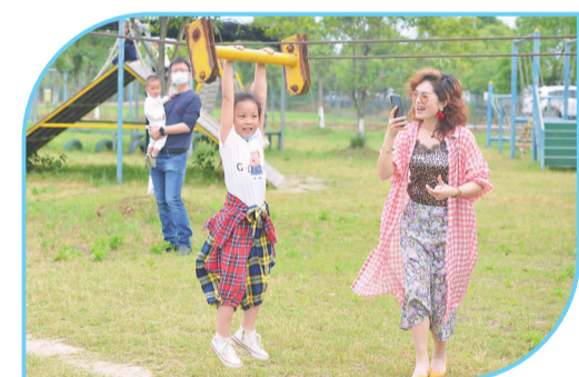
▲悠移庄园体验溜滑梯