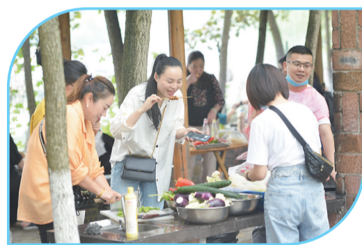
▲亲朋好友相约,一起野炊烧烤

草长莺飞,万紫千红,五一假期怎可辜负?在疫情常态化防控的特殊时期,很多市民取消去外地旅游的计划,近郊游比往年更火了。