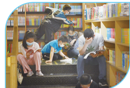
▲在书香中乐享假日时光