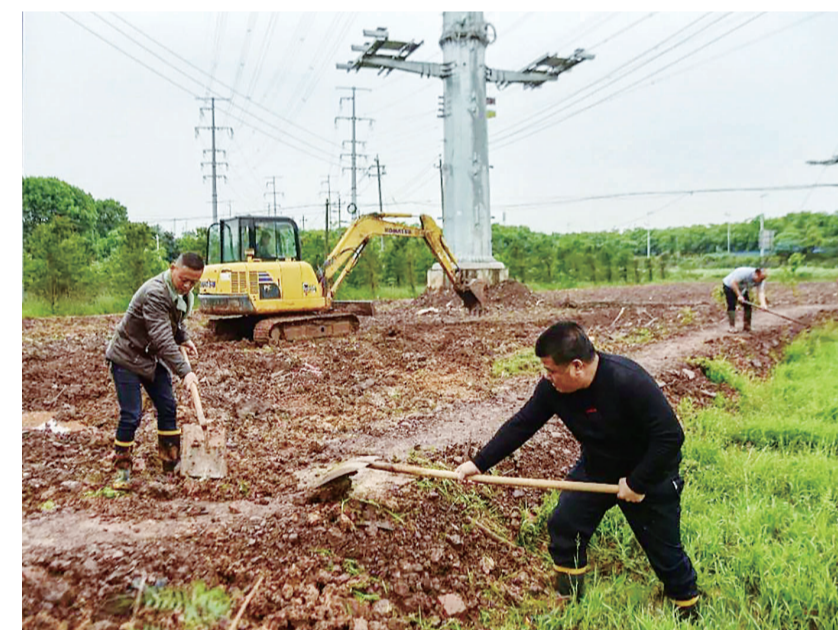
▲经开区将数据网络架设工程中占毁的水田、菜地恢复原貌

“现在工程建设遗留问题彻底解决了，稻田、菜地和油茶林地都恢复了原貌，春耕生产也顺利进行了。”近日，经开区龙头铺街道兴隆社区居民们的心情挺不错。