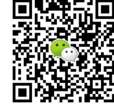
扫一扫上图二维码,添加微信