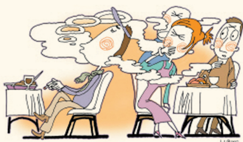
公共场合不要随意抽烟