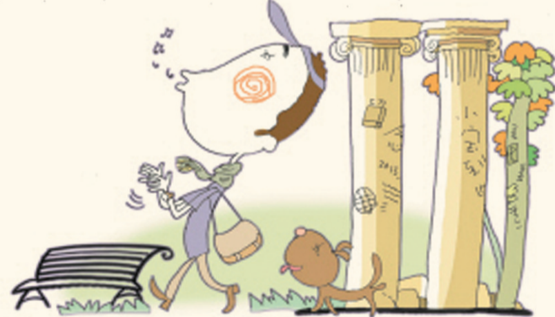
旅游景点禁止乱涂乱画