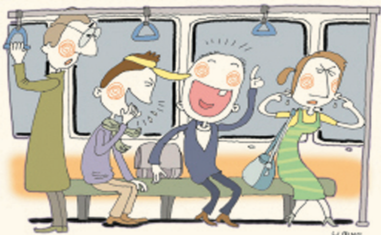
公共场合不要大声喧哗