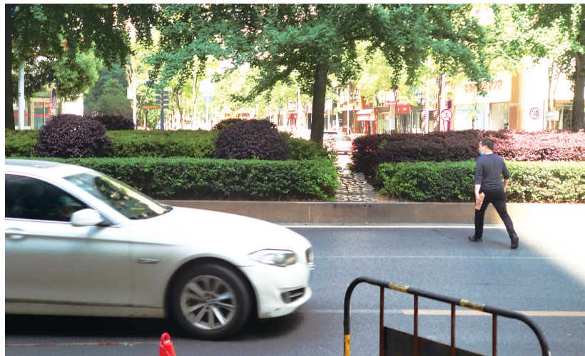
行人在庐山路路段横穿马路。

方女士说,每天上班,她都要在小区门口正对面的庐山路的公交车站等车,如果要走斑马线,则要绕过路中央的绿化带,走庐山路南侧的黄河北路路口过马路,前前后后要花五六分钟的时间,而直线横穿马路就省事不少。