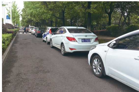
湘山路边,车辆排长龙,路面无停车位。

有大观邸小区、新安居建材市场、红星美凯龙市场、中欧·昆仑首府小区、华府龙苑小区、恒大华府小区等。记者沿线观察发现,2公里长的湘山路段,非机动车道上没有施划一个停车位,但停放的车子上百米。