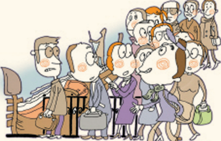
遵守秩序禁止插队