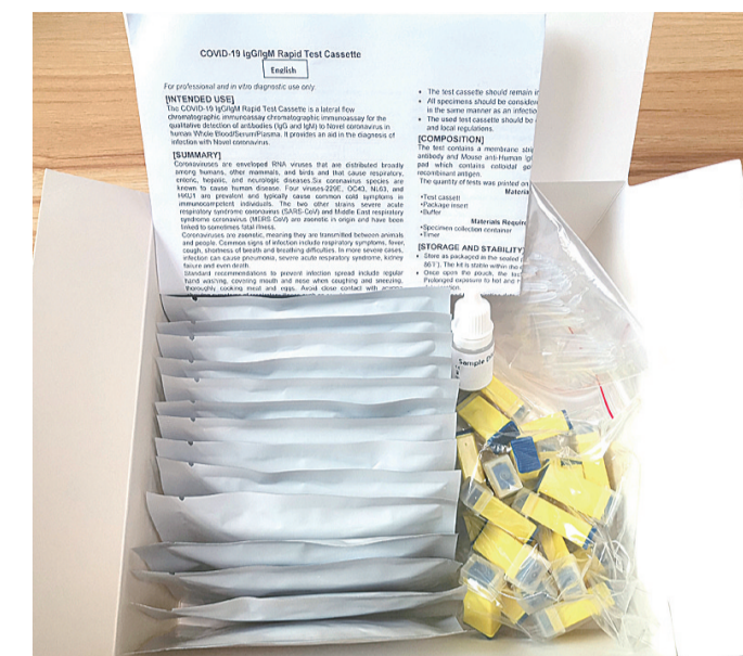
▲中科蓝海的新型冠状病毒快检测试剂盒

中科蓝海的这种新冠检测试剂盒通过检测人体血液中的病毒抗体水平,既可以作为核酸检测阴性的情况下作辅助确诊,也可以对疑似病例进行快速排查、筛查,具有极高的普适性。