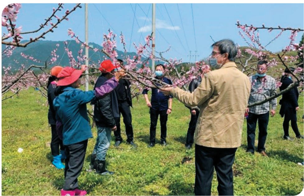
▲春暖花开,科技人员田间地头指导“三农”工作。

只争朝夕,不负韶华。科技系统干部职工对准奋力建成国家创新型城市、争当国家自主创新示范区标杆和全省“科技投入产出真抓实干”样板这个“一创双争”目标,点燃“第一动力”,激活“第一资源”,精准发力打通科技惠民惠企“最后一公里”,为夺取疫情防控和经济社会发展“双胜利”提供强大的科技支撑。