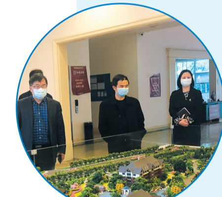
▲市科技局副局长李黎明陪同科技专家在经开区调研。