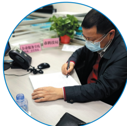
▲市科技局党组成员、副局长龚道富接听企业服务热线。

线上解难题,线下抓落实。3月以来,市科技局积极组织各类科技项目申报工作,积极为企业事业单位和“双创”团队提供重大信息、争取政策支持、搞好后勤保障,全力构建创新创业“新生态”。