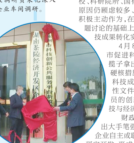
▲市科创平台茶陵站揭牌。