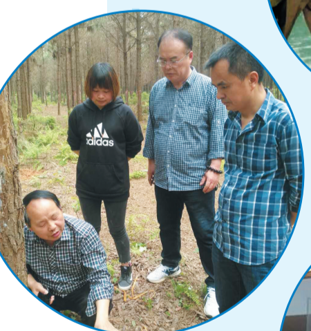
▲两名省科技特派员在攸县指导农业生产。

谷雨之后,“三农”工作进入新阶段。围绕脱贫攻坚和乡村振兴战略,市科技局将做好新一轮市派科技特派员选派和科技专家服务团队组建工作,进一步扩大科技专家服务团队队伍,筑牢全面小康“新防线”。