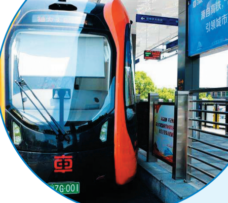
▲智能列车从动力株洲走向世界。