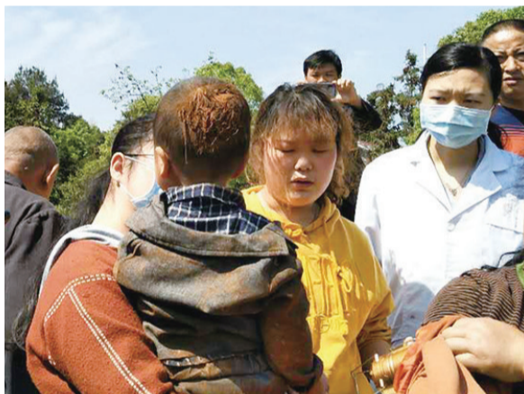
▲佳佳获救无大碍,家人松了口气