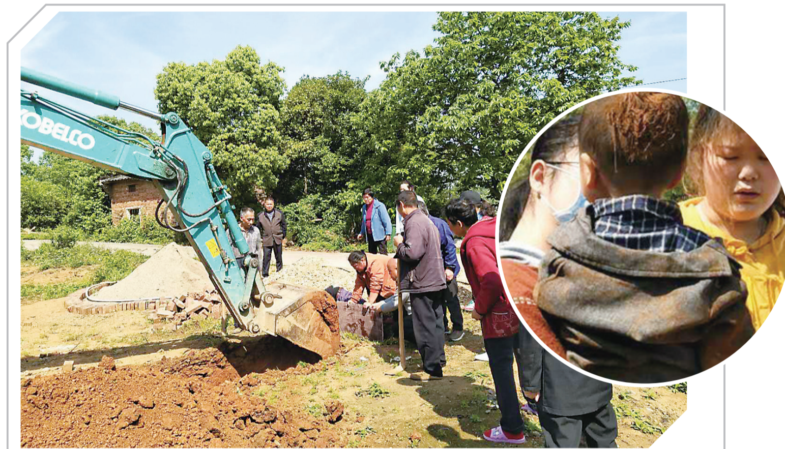
▲救援现场