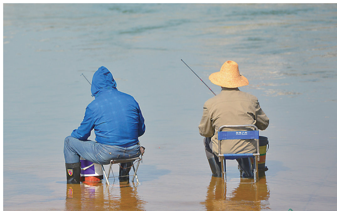
▲4月26日,太阳有点火辣,两位市民在垂钓

每日金句 有两种不联系:一种是忘记了,一种是放在回忆里。——刘同《谁的青春不迷茫》