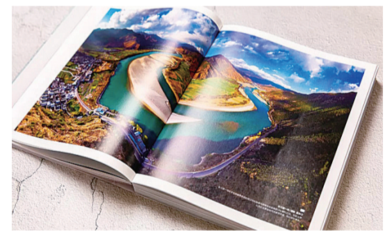
▲长江第一湾

《这里是中国》由人民网、中国青藏高原研究会、星球研究所联合出品,是国内第一部全视野中国地理科普著作。书中以《中国从哪里来?》和《什么是中国?》两个章节展开内容,从自然规律到人类文明之美。3年夜对内容的精心打磨,365处极风光的瞬间捕捉,519页充满温情的中国故事,1000小时绘制53幅专业地图……从整体构建出中国的形象,堪称一部书架上的《最美中国》纪录片。