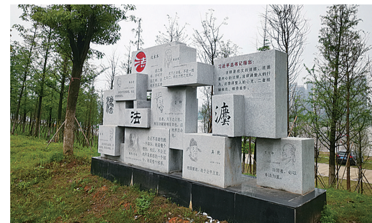
▲株洲市法治文化广场实景图

株洲市法治文化广场(长廊)位于石峰大桥北桥头,紧邻湘江,项目占地面积15000平方米。项目包含15个单体或群体雕塑,以市二水厂临江护坡墙为巨幅宣传墙,墙面面积约550平方米。广