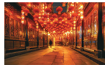
▲成都锦里