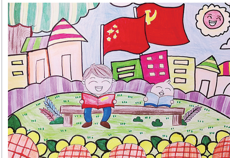
我喜欢看书 白鹤小学1806班 李宗霖 指导老师:文珏