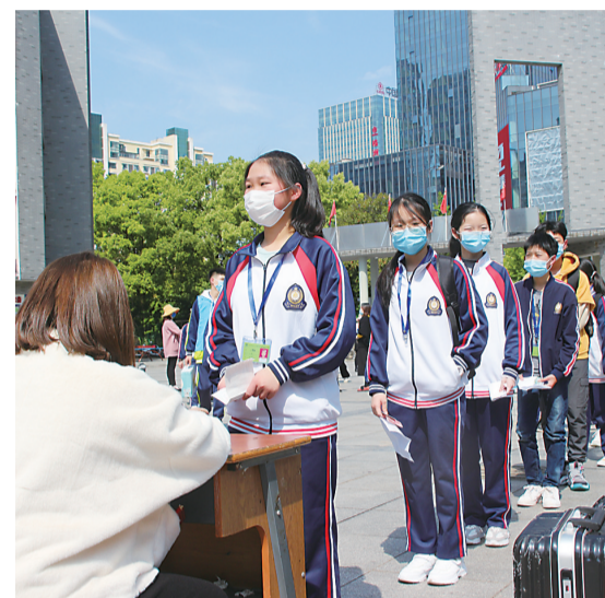
▲排队在班主任老师处办理报到手续