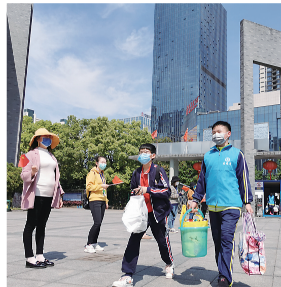
▲蓝色马甲志愿者协助同学们搬运行李