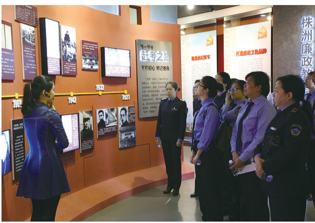
不忘初心 牢记使命学习教育