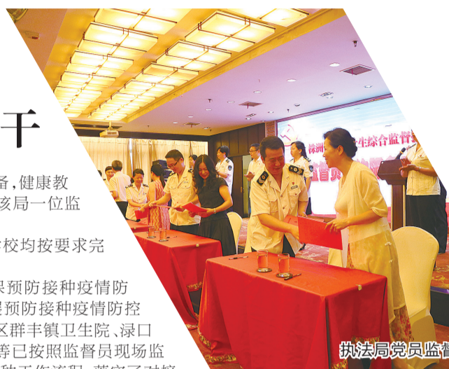
执法局党员监督员签约

由于出厂的餐(饮)具未按规定开展产品自检并随附消毒合格证明等违法行为,两家单位被要求立即改正。“我们耐心地对这些单位给予了集中的监督和指导,防止食品安全卫生事件发生,保障人民群众用餐安全,也是服务企业、保护企业。”参与宣讲的一位执法人员说。