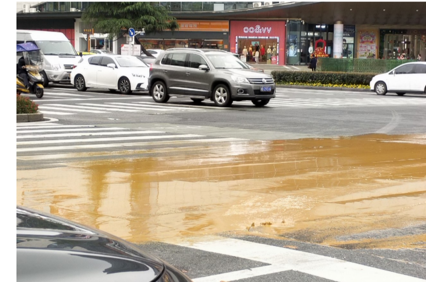
▲昨天上午,天台路上涌出黄泥水