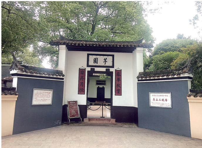
李立三故居外景。

在李立三故居陈列馆里展出这封信的内容,信的抬头为:“立三兄”,信中讲到,因为好久没有和李立三通信了,不知道李立三的地址,还称自己的知识饥荒到了十分,拜托李立三同志经常邮寄书籍。