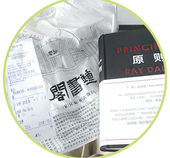
(北京书店外卖单。)