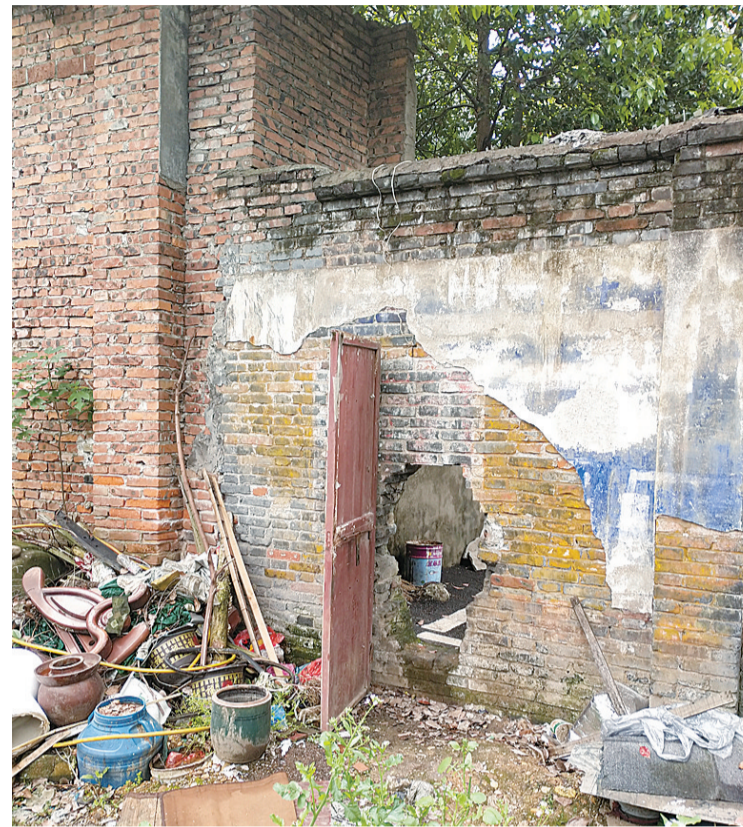
▲为丢垃圾专门开凿的墙洞

本报讯(见习记者 廖智勇)前天上午,家住贺家土电池厂小区的周大爷给晚报热线28829110打来电话称,在他家附近的京广铁路线