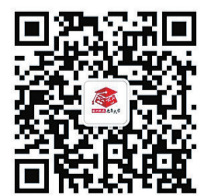
株洲晚报老年大学微信公众号