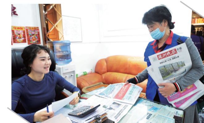
▲昨日,芦淞市场群中国城服装市场,晚报发行员给商户派送晚报,并介绍公益特刊内容

接下来,《株洲日报社全媒体“暖市”消费指南公益特刊》还将陆续推出,其中,《株洲晚报》将推出“市场篇”“餐饮篇”。