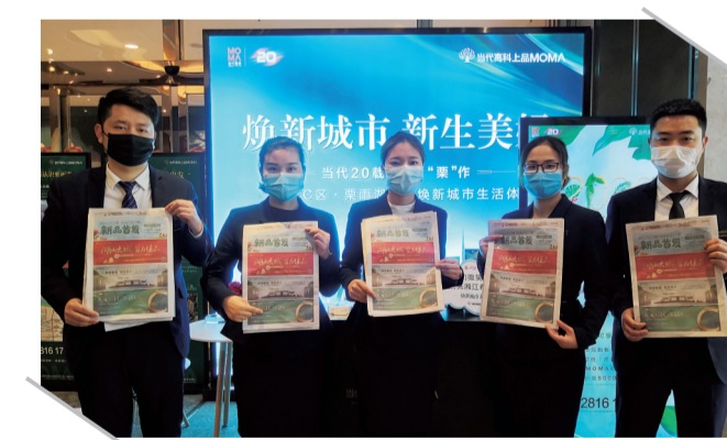
▲房地产企业代表为特刊点赞