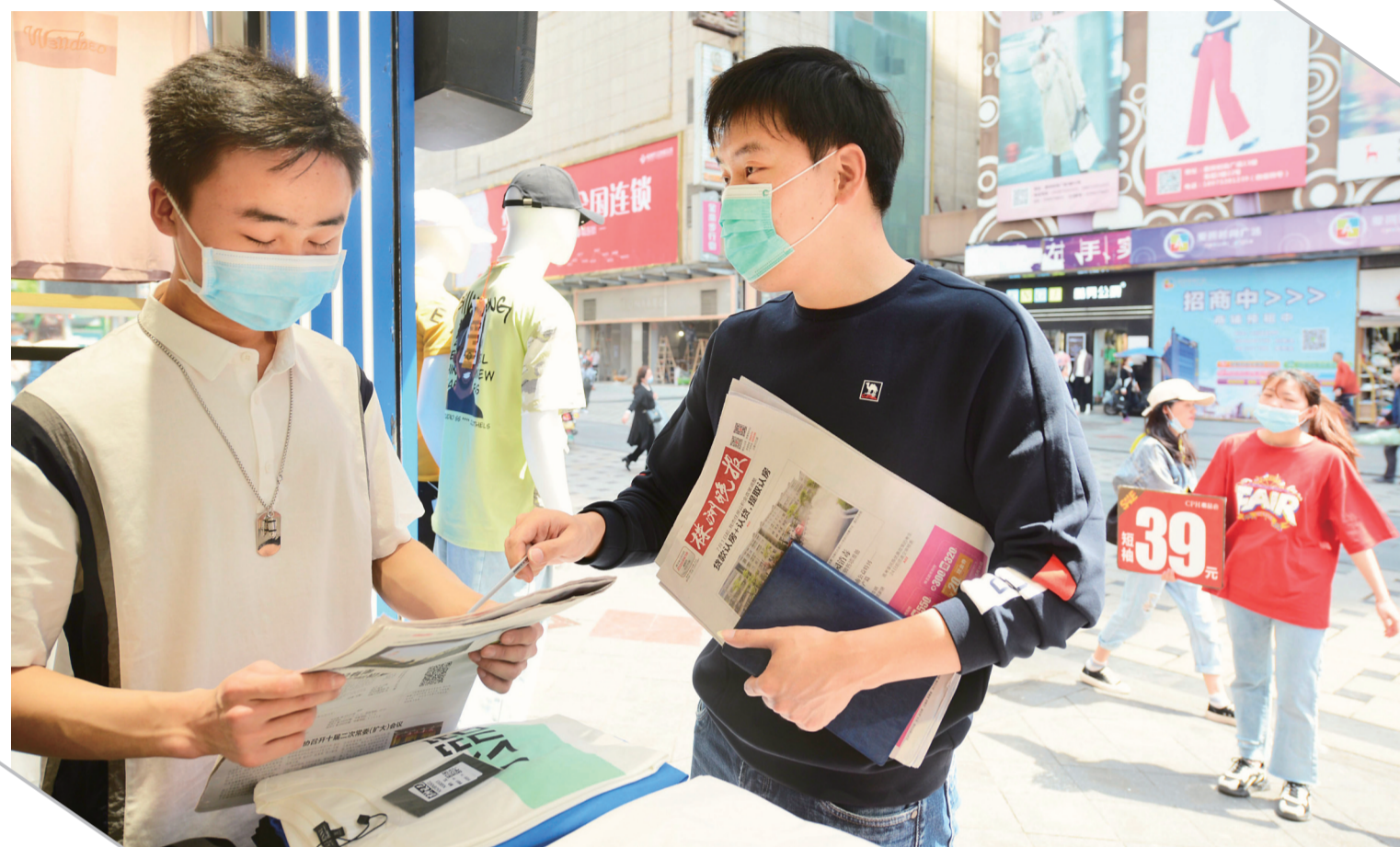
▲昨日,芦淞市场群,晚报记者给CPH潮品会服装店经营者发送株洲晚报,并介绍晚报当天刊发的公益广告内容

最美人间四月天。一场疫情,打乱了市民生活节奏。眼下,疫情的阴霾尚未完全散去,但春天已阔步走来,株洲经济社会各方面也正在逐步恢复常态。