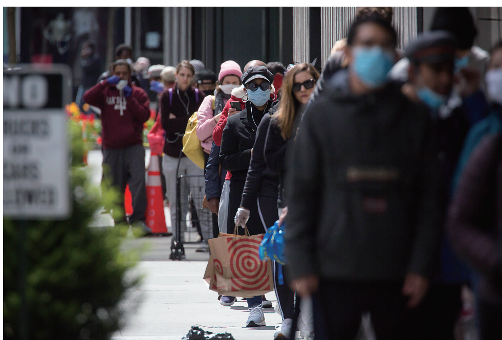
4月14日,在美国纽约,人们在一家超市外排队等待购物。