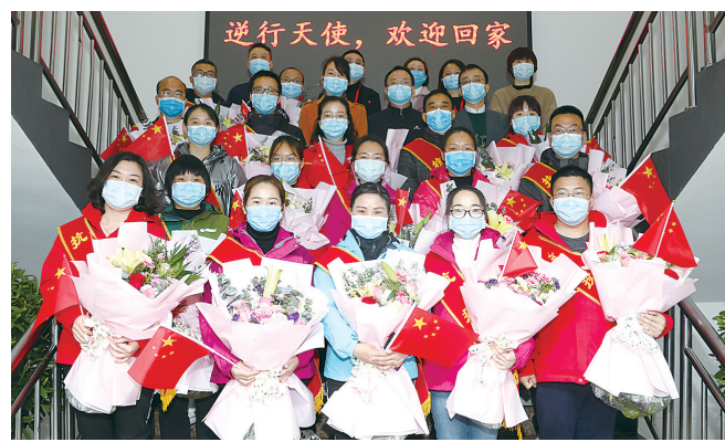
▲抗疫英雄,平安归来

疫情来袭,全院员工凭着无私奉献、勇于担当、尽职尽责、不计得失的工作精神,为抗击新冠肺炎疫情筑起了一道牢固的安全防线。