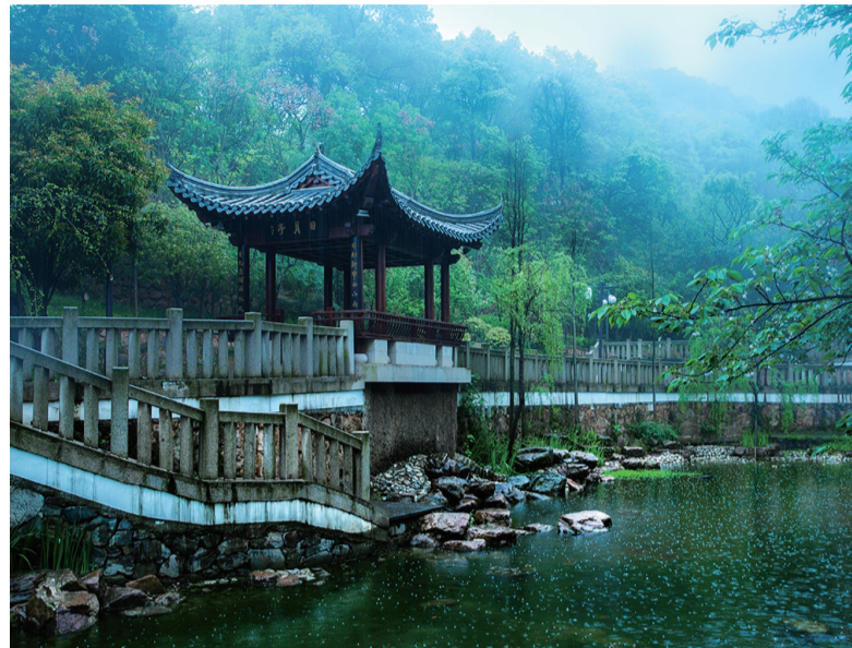
▲淥江书院内景

本报讯(全媒体记者 温琳 通讯员 向珊珊)利用好红色资源、发扬好红色传统、传承好红色基因。近日,省委宣传部公示第五批湖南省爱国主义教育基地名单,淥江书院、醴陵烈士陵园榜上有名。