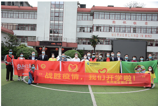
▲建行株洲分行工作人员和爱心志愿者合影

一天的活动,志愿者们为601学校和红旗路小学三个校区7栋教学楼、142间教室、39间寝室、53间办公室、1间隔离室和所有的走廊、卫生间进行了全面的消毒。几