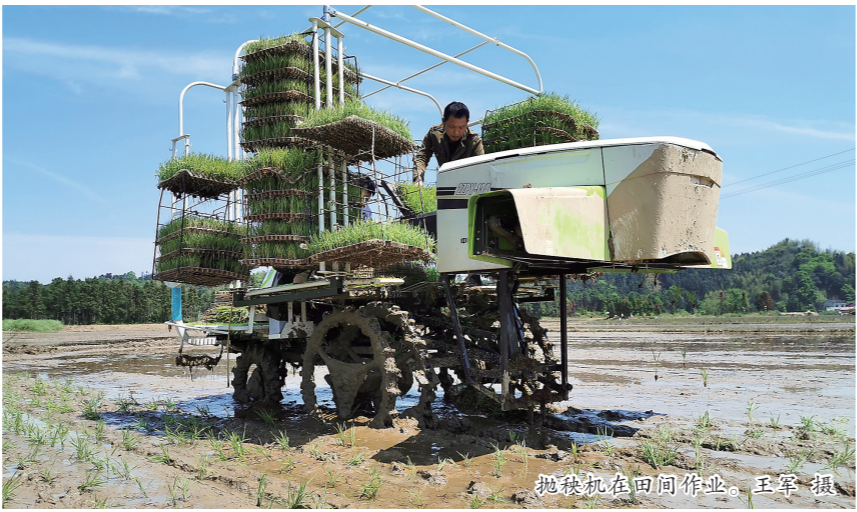
抛秧机在田间作业。