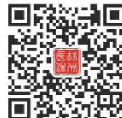
株洲医保微信公众号

2020年4月10日至5月31日未按规定时间缴费的,将影响其正常享受医疗保险相关待遇。参保者在规定的时间内可前往华融湘江银行株洲市分行任一网点进行缴费,或者通过“株洲医保”微信公众号手机缴费。