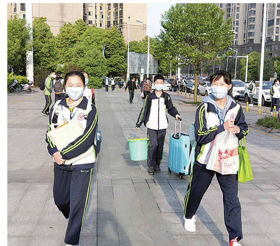
▲昨日,天元中学学生快乐返校

本报讯(首席记者 何春林 通讯员 吴育珍 丁仁礼)昨日上午,我市高一、高二和初一、初二学