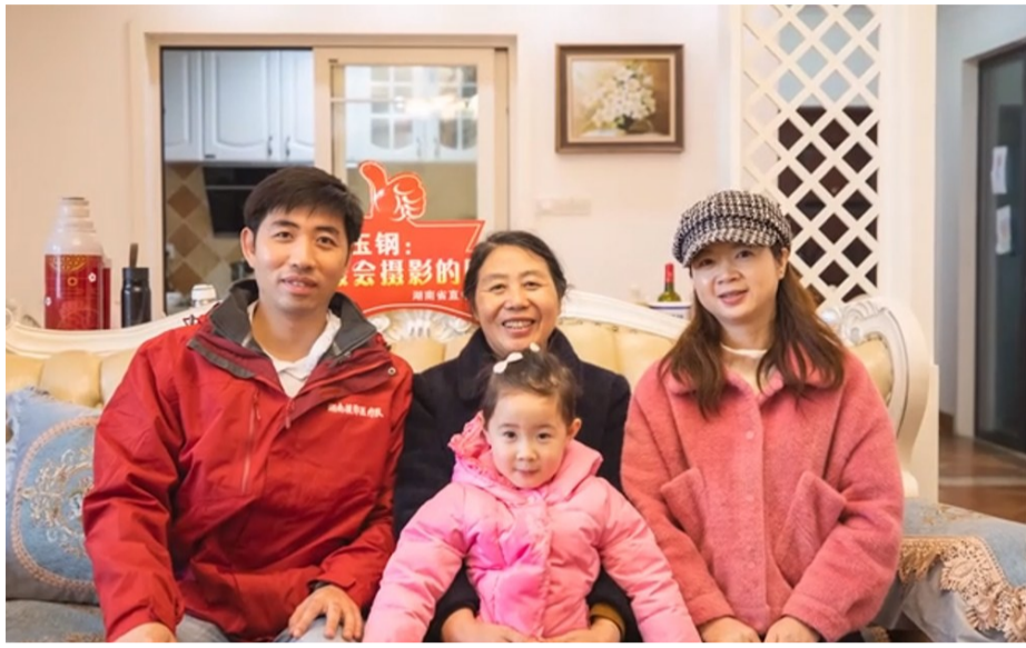
英雄回家团圆。(视频截图)

顶着风雪逆行,伴着春风回家。株洲市76名驰援黄冈的医疗队员,在结束希尔斯顿酒店的隔离休整后,重回家人朋友们身边。在湖北黄冈,他们是白衣执甲的战士,是抗击疫情英雄;回到家里,他们是妈妈的宝贝、妻子的超人丈夫、孩子的母亲。这一刻,距离他们大年初一逆行出征,时间已过去69天。近日,记者分别跟拍3名荣归故里的英雄,从他们踏出隔离休整酒店开始,为你全程记录了他们的回家历程,用手机微信“扫一扫”功能扫码观看视频。