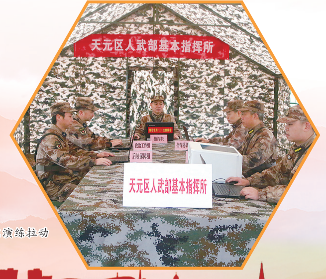
天元区人武部基本指挥所