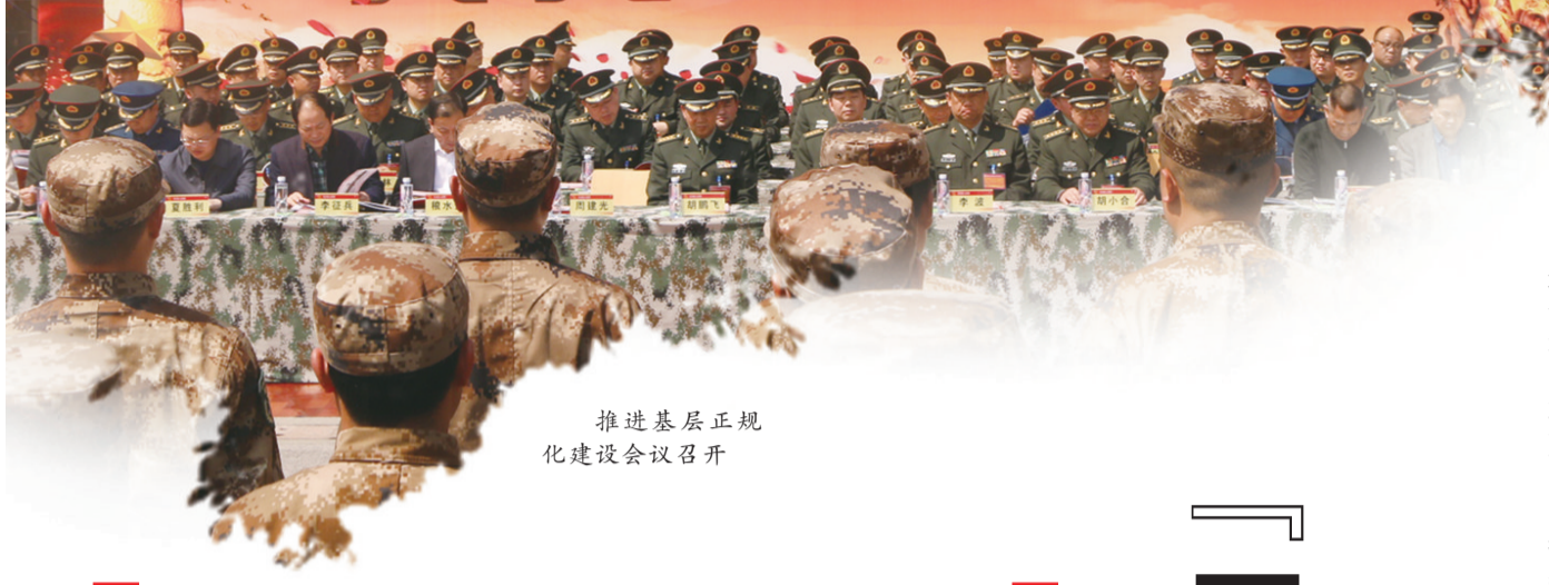
推进基层正规化建设会议召开