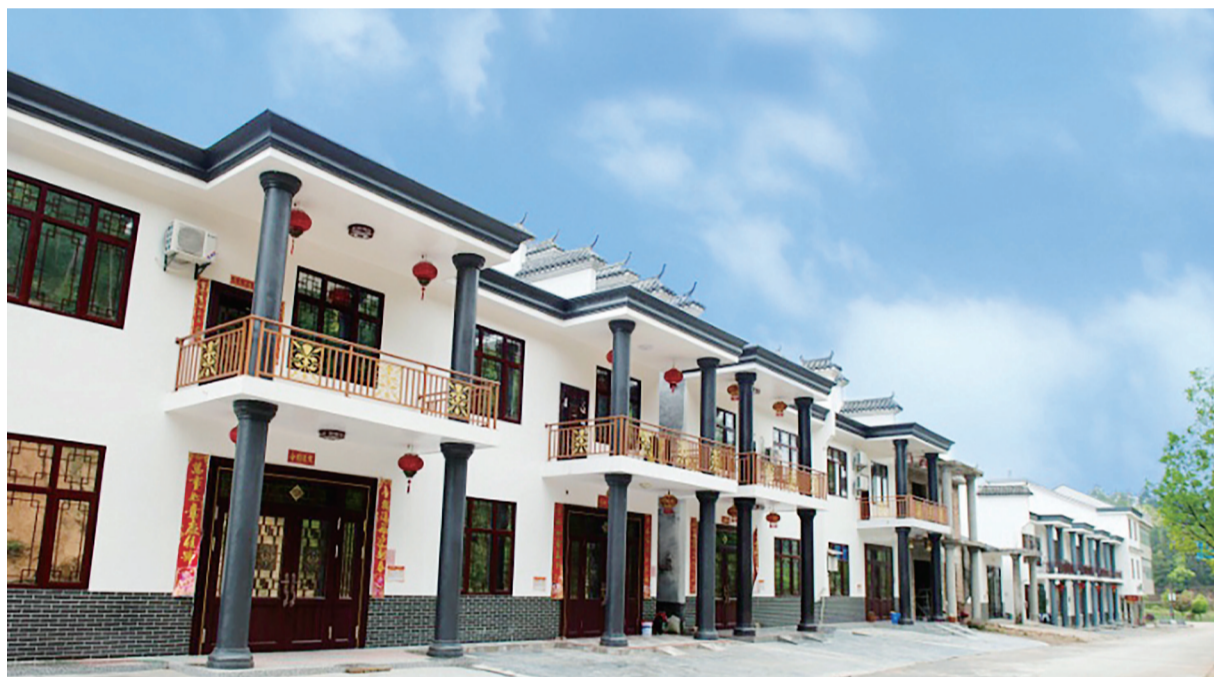
▲攸县丫江桥镇新房风貌

在自家的一亩三分地上建房,难道不是想怎么建就怎么建?还真不是。昨日,市人大常委会召开动员会,正式启动对农村建房贯彻实施《株洲市农村村庄规划建设管理条例》(以下简称《条例》)情况的执法检查。