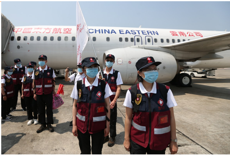
4月8日,中国政府派遣的抗疫医疗专家组抵达缅甸仰光国际机场。

据悉,中国已向120个国家和4个国际组织提供了包括普通医用口罩、N95口罩、防护服、核酸检测试剂、呼吸机等在内的物资援助。