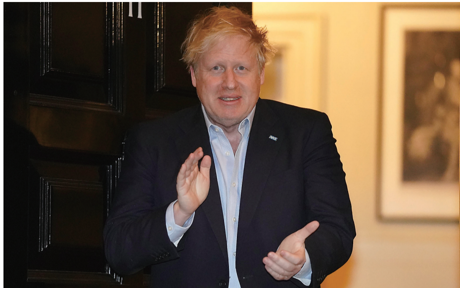
4月2日晚,英国首相约翰逊在伦敦唐宁街11号门口为NHS医护人员鼓掌。