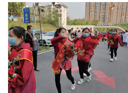
▲株洲市人民医院欢迎29名在溇口定点医院及黄冈抗疫归来的医护人员